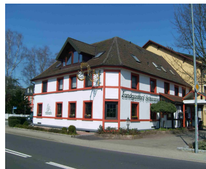
Restaurant „zum Schwanen“

Danach ging es erstmal was Gutes essen. Im Restaurant zum Schwanen in Kork haben wir uns dann mit gut bürgerlicher Küche für den zweiten Tauchgang gestärkt. Um 14 Uhr ging es dann wieder ins Wasser zum 2.TG an diesem Tag.